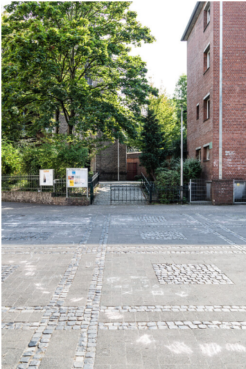
Schillplatz in Köln-Nippes (2021)