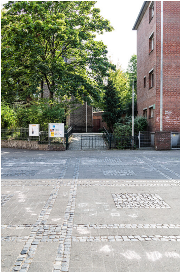
Schillplatz in Köln-Nippes (2021)