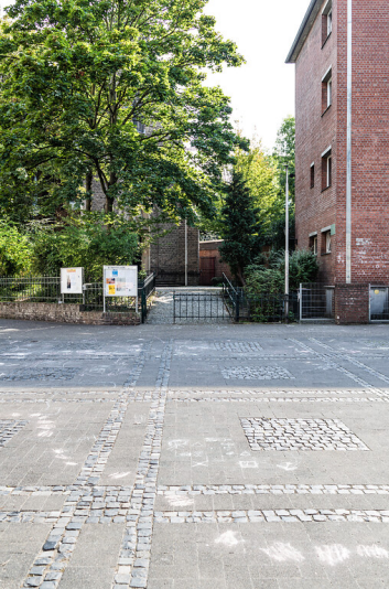
Schillplatz in Köln-Nippes (2021)