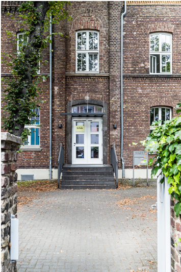
Eingang zur Louise-von-Marillac-Schule in Köln-Nippes (2021)