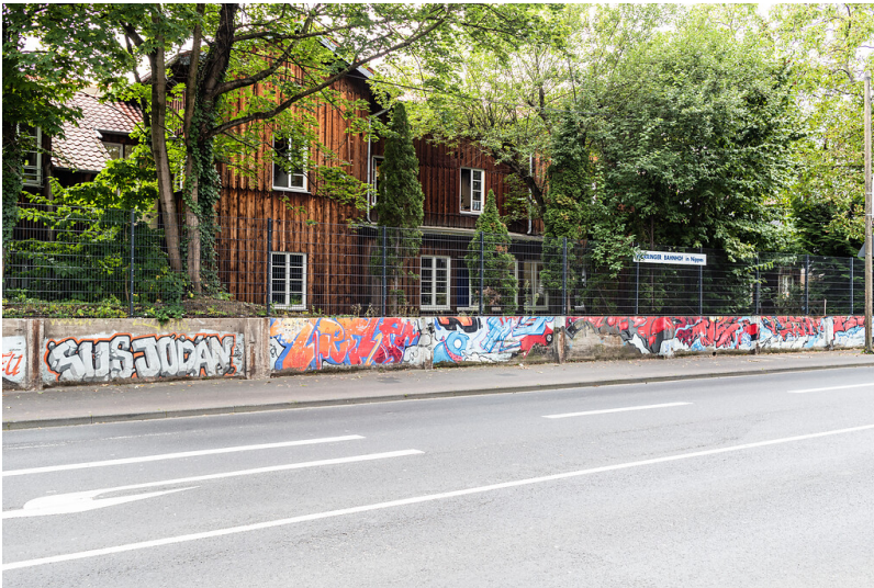
Der translozierte hölzerne Bau des ehemaligen Worringer Bahnhofs in Köln-Nippes (2021)