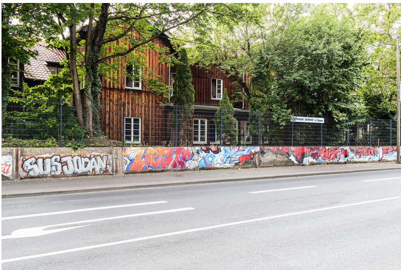
Der translozierte hölzerne Bau des ehemaligen Worringer Bahnhofs in Köln-Nippes (2021)