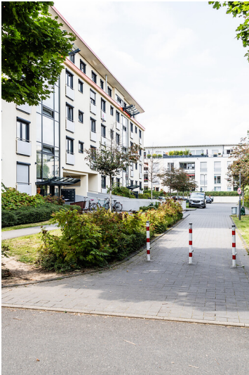
Heutige Wohnsiedlung auf dem ehemaligen Gelände des Eisenbahn-Ausbesserungswerks in Köln-Nippes (2021)