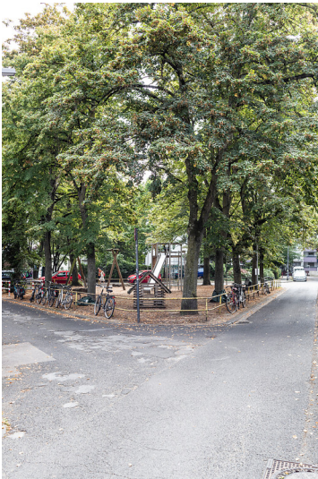
Wartburgplatz und Eisenachstraße in Köln-Nippes (2021)