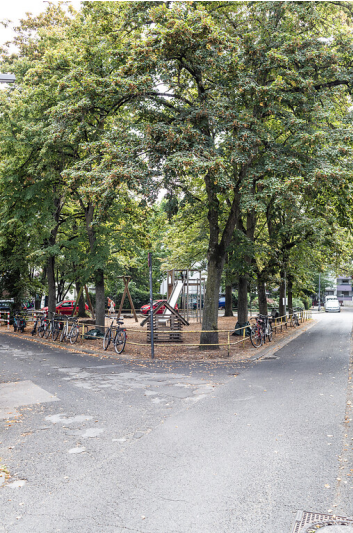
Wartburgplatz und Eisenachstraße in Köln-Nippes (2021)