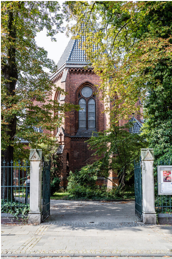
Eingang zur KulturKirche in Köln-Nippes (2021)