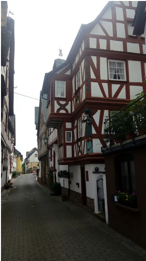
Christophorus-Haus in Blickrichtung Süden