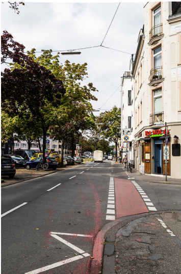
Kempener Straße in Köln-Nippes (2021)