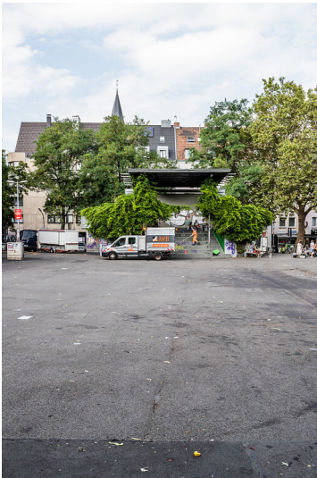
Wilhelmsplatz in Köln-Nippes (2021)