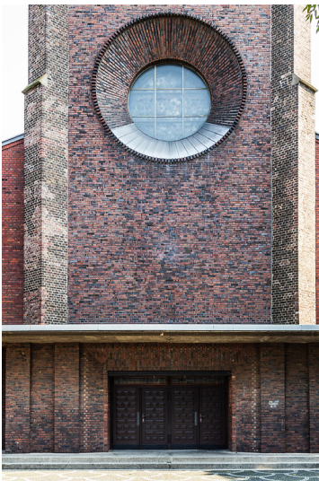
Portal von Sankt Marien in Köln-Nippes (2021)