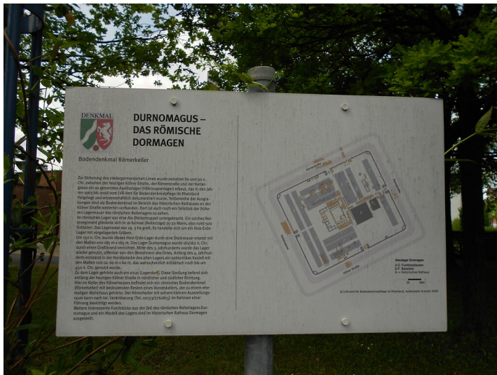
Tafel "Durnomagus - Das römische Dormagen" (2015)