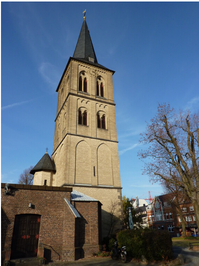
Kirchturm von St. Michael in Dormagen (2011)