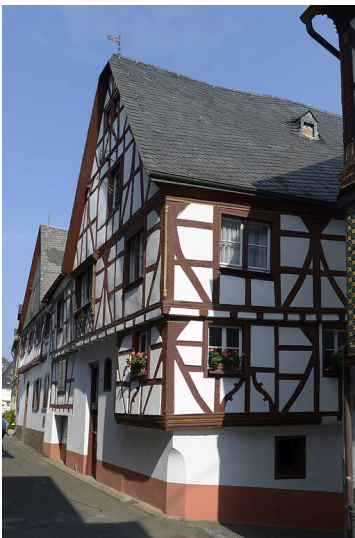
Fachwerk-Wohnhaus Christophorusstraße Sankt Aldegund (2017).