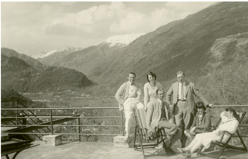
Bild 1: Der Kronenburger Freundeskreis um 1930 während einer Urlaubsreise ins Tessin auf der Dachterrasse des Kurhotels Monte Verità