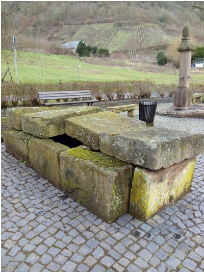
Sandstein-Quader des Steinkammergrabes in Sankt Aldegund(20218)