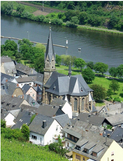
Außenansicht der Pfarrkirche aus den Weinbergen gesehen