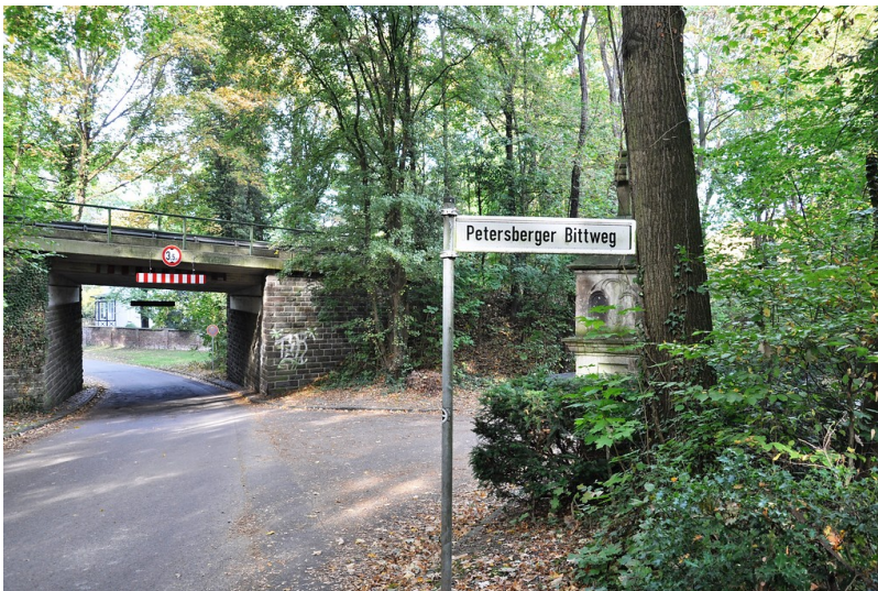
Aufnahme Richtung Westen der Straßenkreuzung "Petersberger Bittweg"/"Am Lessing" in Königswinter (2018).