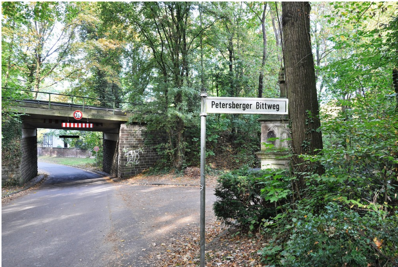
Aufnahme Richtung Westen der Straßenkreuzung "Petersberger Bittweg"/"Am Lessing" in Königswinter (2018).