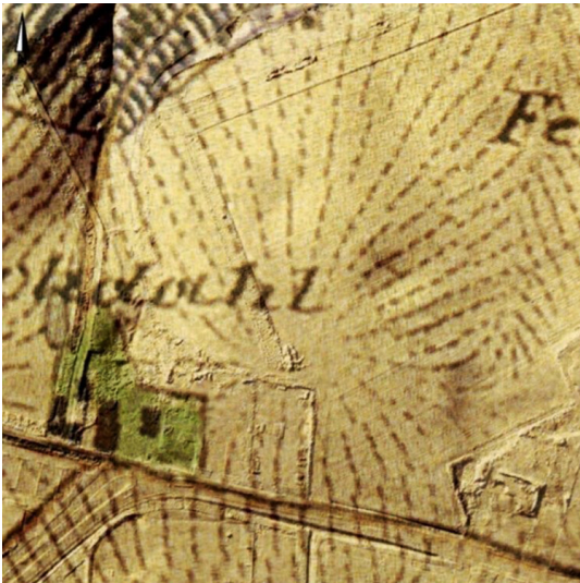
Kartenausschnitt der Uraufnahme 1835-1850, 1:2000, hinterlegt mit einer plastischen Wiedergabe der Geländeformen als Schummerung.