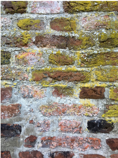
Nahaufnahme der Mauer am Schloss Liedberg (2018)