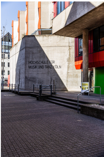
Eingang zur Hochschule für Musik und Tanz Köln (2021)