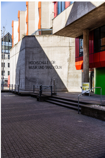
Eingang zur Hochschule für Musik und Tanz Köln (2021)