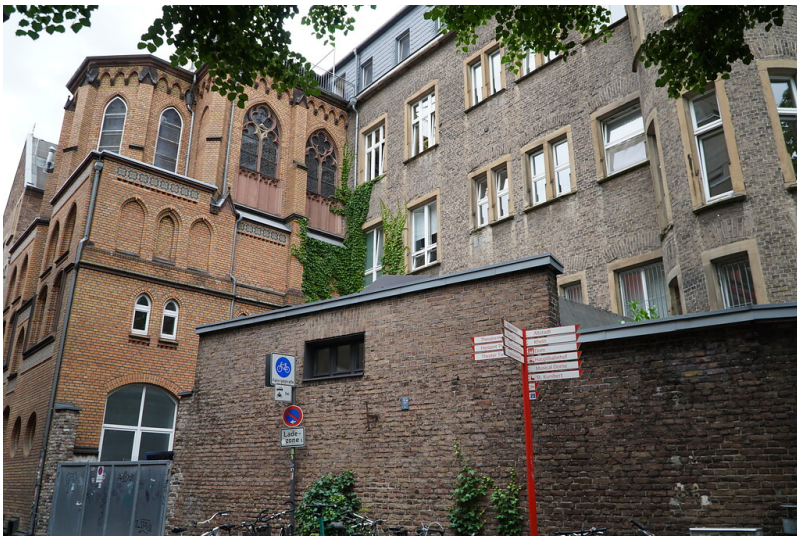
St. Marien-Hospital mit angrenzender Kapelle in Köln-Altstadt-Nord (2021)