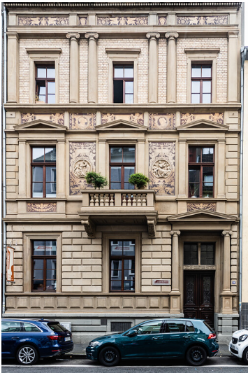
Beeindruckendes Wohnhaus aus dem 19. Jahrhundert in der Machabäerstraße in Köln Altstadt-Nord (2021)