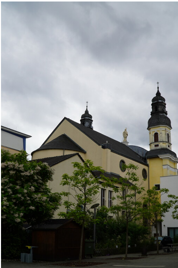
Rückseite der Ursulinenkirche Corpus Christi in Köln (2021)