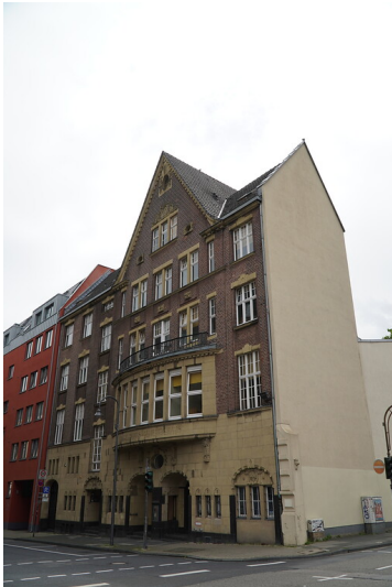
Blick von der Turiner Straße auf die ehemalige Kreuzkirche im Kölner Eigelsteinviertel (2021)