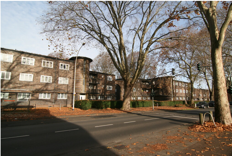
Laubenganghaus Typ I am Freiheitsring in Frechen (2021)