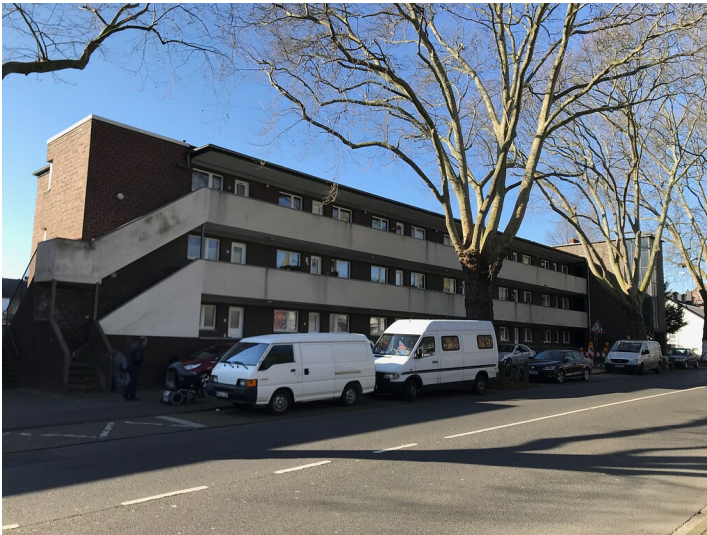
Dreigeschossiges Laubenganghaus Typ 2 am Freiheitsring in Frechen (2020)