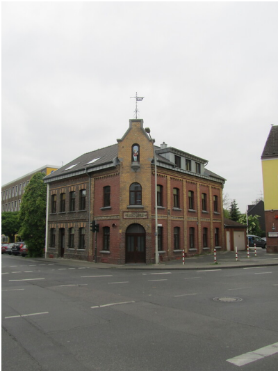
Backsteinhaus der Gaststätte "Zur deutschen Ecke" (2014)