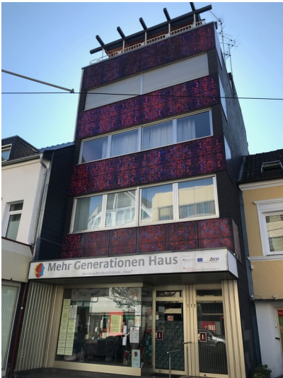
Wohn- und Geschäftshaus mit rot-blauer KerAion-Fassade in Frechen (2020)