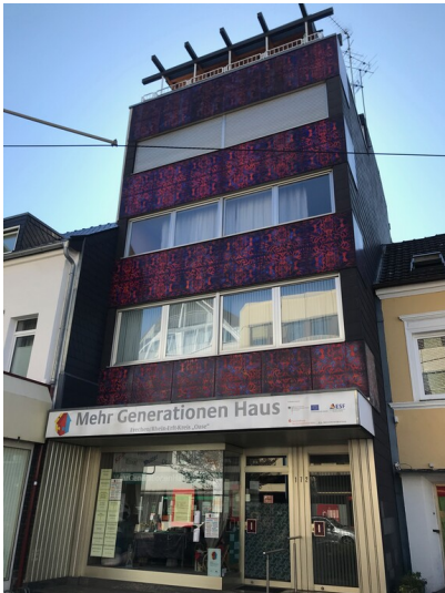
Wohn- und Geschäftshaus mit rot-blauer KerAion-Fassade in Frechen (2020)