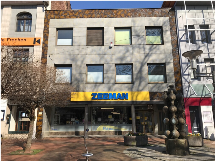
Wohn- und Geschäftshaus mit Fassadenverzierung aus braunen KerAion-Platten in Frechen (2020)