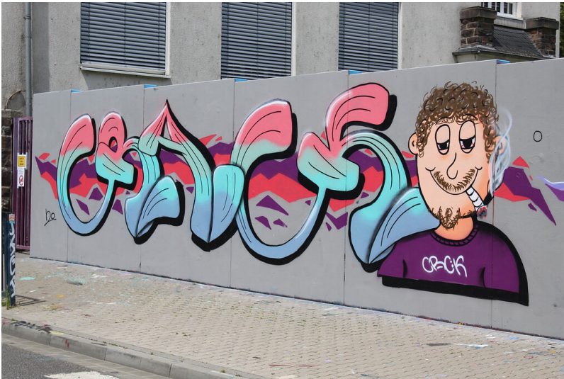
Mauerabschnitt an der Weinbergstraße in Koblenz-Lützel (2020)