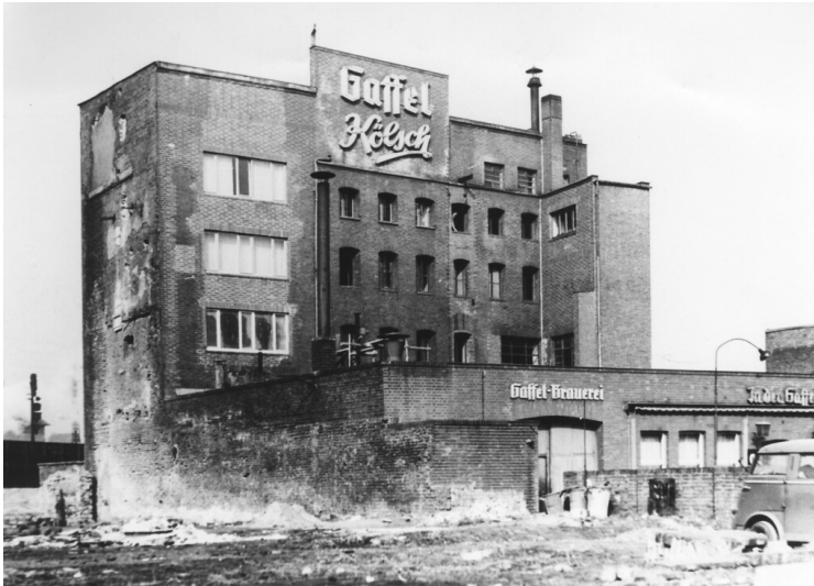
Die Gaffel-Brauerei (nach 1945)