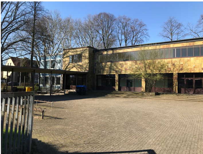
Die Fassade des ältesten Bauabschnittes der Lindenschule (heute Realschule) ist mit gelben Steinzeugplatten verkleidet (2020)