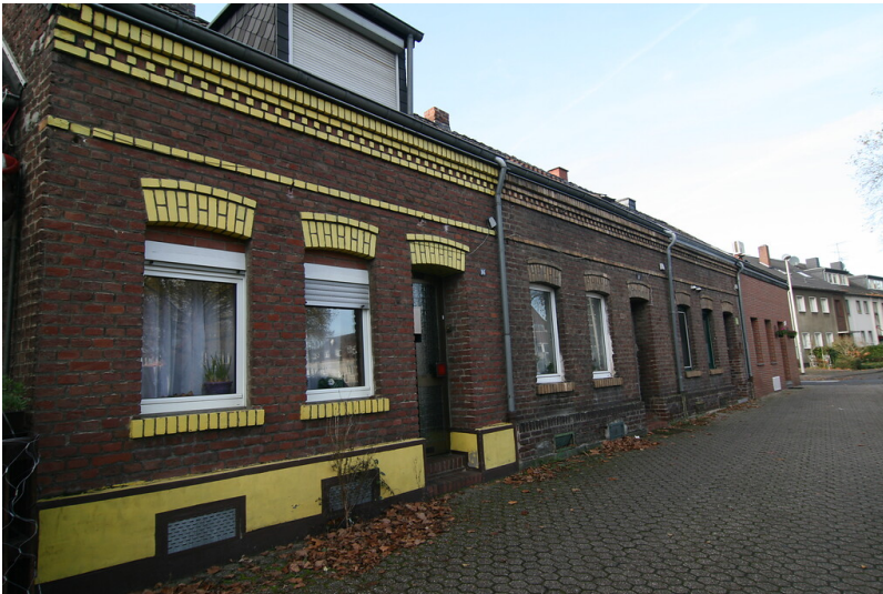
Arbeiterhäuser der Steinzeugfabrik Dorn (2021)