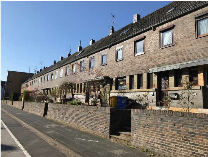
Die Fassaden der Reihenhäuser Typ I in der Keimesstraße in Frechen sind im Erdgeschoss mit Steinzeugplatten verziert (2020)