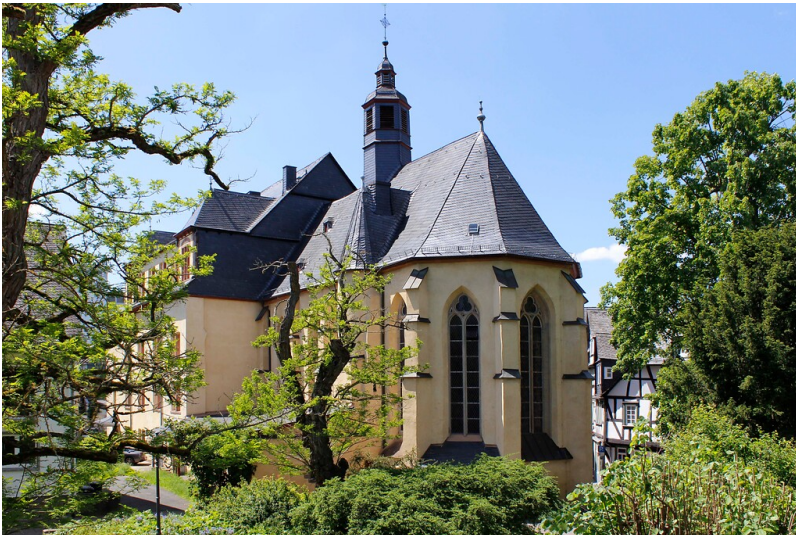
Untere Stadtkirche in Wetzlar (2021)