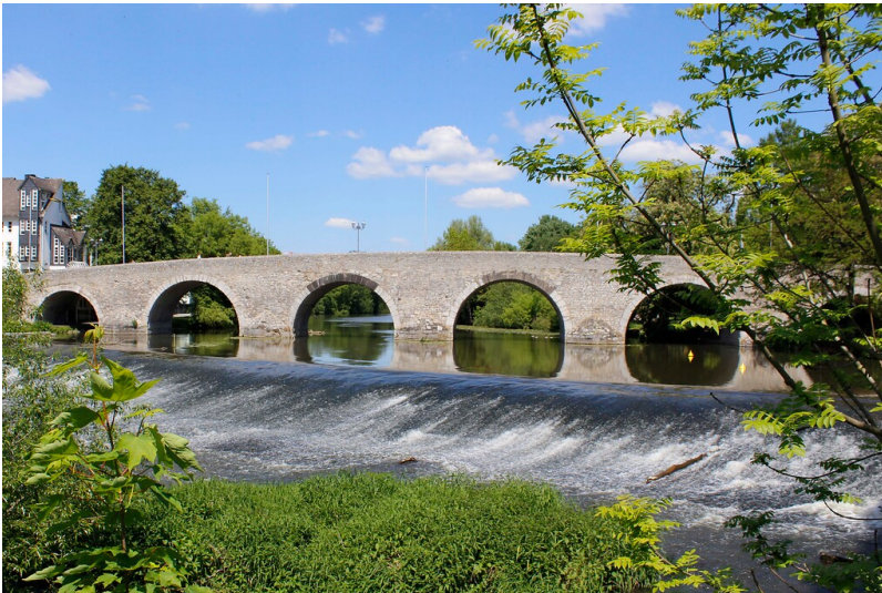
Alte Lahnbrücke in Wetzlar (2021)