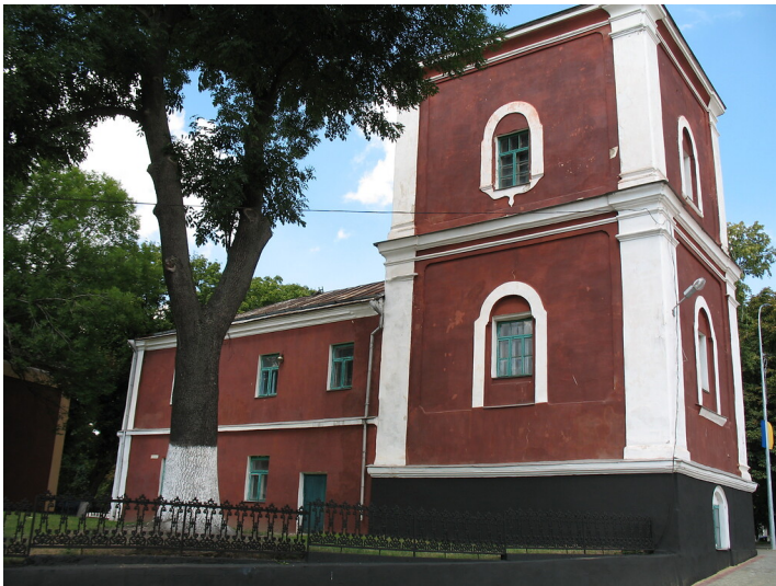
Dominican Monastery in Volodymyr-Volynskiy (2016)