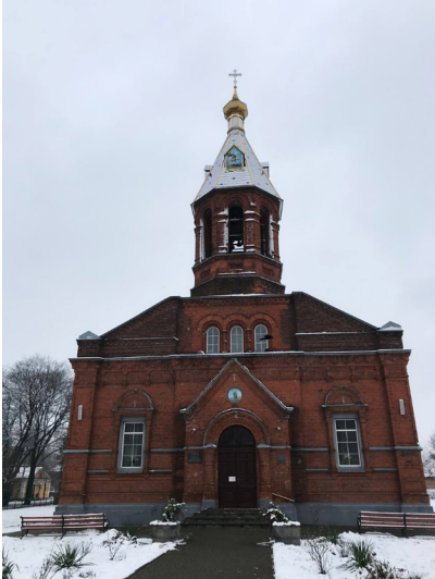
St. Georges Church in Volodymyr-Volynskyyi (2021)