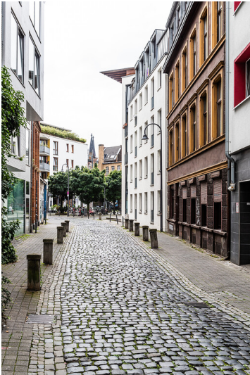
Gasse "Im Stavenhof" im Kölner Eigelsteinviertel (2021)