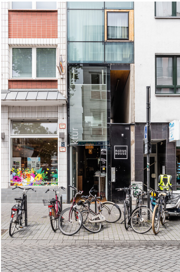
"Das schmalste Haus von Köln" im Eigelsteinviertel (2021)