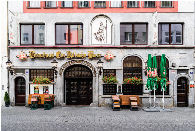
Brauhaus "Em Kölsche Boor" im Kölner Eigelsteinviertel (2021)