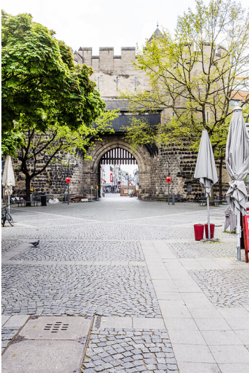
Blick vom Ebertplatz auf die Eigelsteintorburg in Köln (2021)