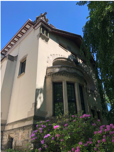
Villa Bestgen am Theodor-Heuss-Ring im Kölner Agnesviertel (2021)