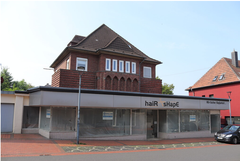
Landhaus Dr. Erkens in Übach-Palenberg (2021)