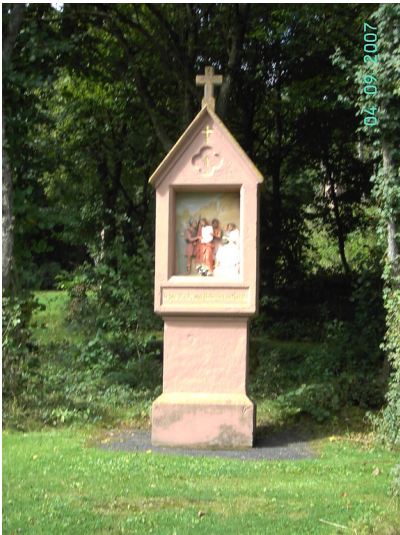
Eine Kreuzwegstation des Kreuzweges an der Heyerkapelle (Heyer-Kapelle) auf dem Heyerberg bei Borler (2007).