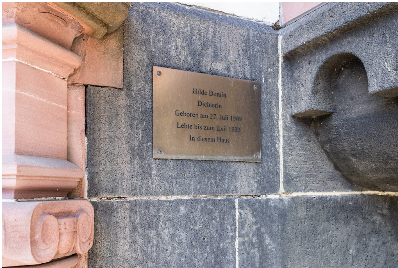
Tafel am Geburtshaus der Dichterin Hilde Domin in Kölner Agnesviertel (2021)